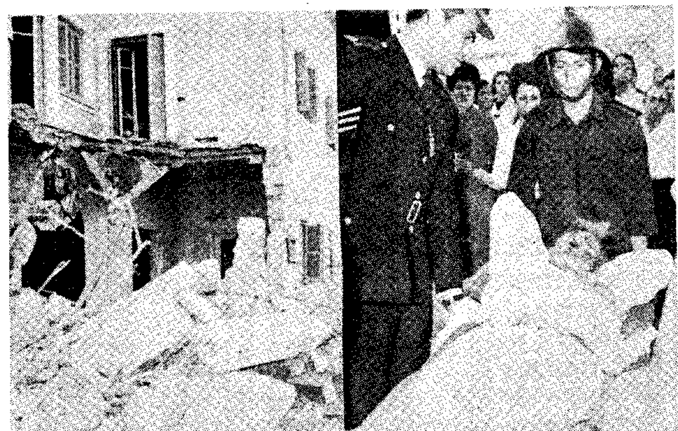
Άπο τήν γειασήν επιδρομήν του «Μαύρου Σεπτέμβριου» εις τήν Λευκωσίαν, Άριστέρα, τραυματισθείς Άραβας μεταφέρεται εις φορείον μακρύν από τήν άνοξηνοβόλον οικίαν του Ίσραηλινου πρεσβευτού (δωξία).

Επίπετοι με επιθέσεις εναντίον των άπολιτικών σταθμών Συλλογών (Λάρνακα) και Κουτράφα (Μόρφου). Κατά τήν άνοξην έπιχερήσαντες έπλησαν ένας εκ των επιθέσεων και ετραυματίσθησαν δύο, ενώ άλλος ένας έτραυματίσθη εκ των άνοξημένων άπολιτικών.